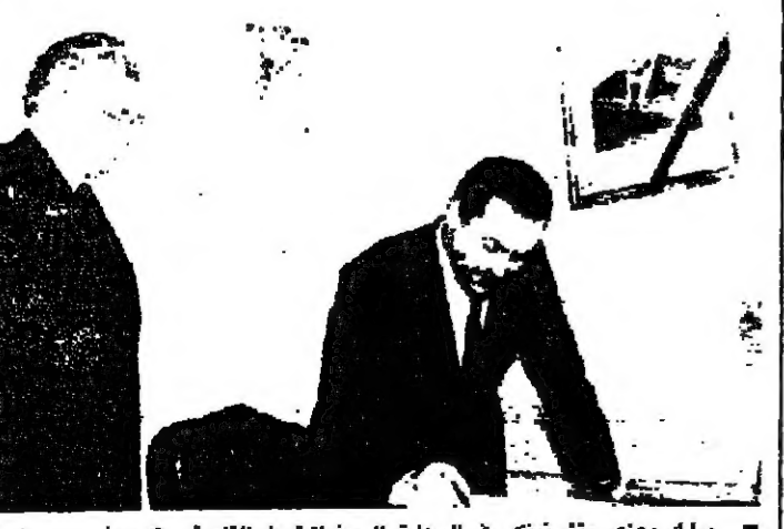
مبارك يعزي بشريته في السفارة السورية في القاهرة (١٠ - رايو)

وقالت وكالة الانباء السعودية الرسمية، ان وزير خارجية الكويت الشيخ صباح الاحمد الصباح ابلغ وزراء خارجية المجلس الذي يضم ست دول خليجية عربية، ان ثمة تطورات خطيرة تؤثر على امن واستقرار المنطقة.